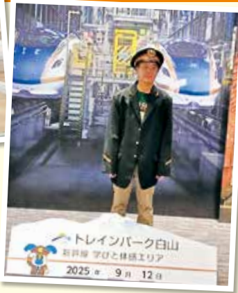
トレインパーク白山 新幹線 アビと体験エリア 2025年 9月 12日