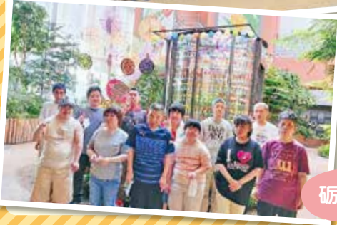
砺波チューリップ公園